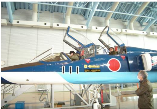
浜松 航空エアパーク ♪

「浜松航空エアパーク」「名古屋城」「リニア鉄道館」を見学・観光して来ました。バス内は利用者さんが独自に考えた自己紹介タイム、名古屋弁クイズ(景品付)など片道5時間