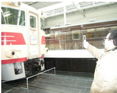
名古屋のリニア鉄道館にて

の道のりを忘れるぐらい盛り上がりました。宴会ではビンゴゲーム!一等の千円のクオカードを狙い職員もガチンコ勝負。 ホテルの前は南知多半島の海が広がり夜は満点の星空、朝は朝陽を見ることができました。特に女性陣は夜通し?女子会をしていたようです。 名古屋名物『ひつまぶし』を堪能。思い出に残る旅行になりました。