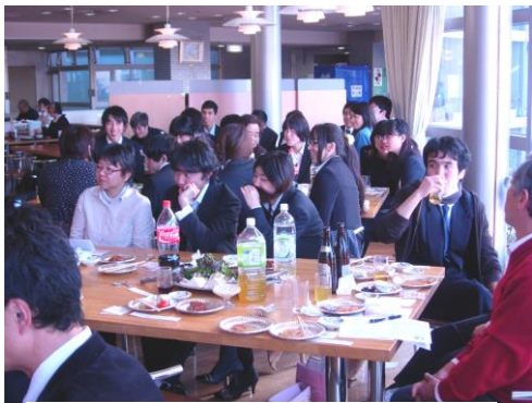
市民体育館にて 祝・成人!