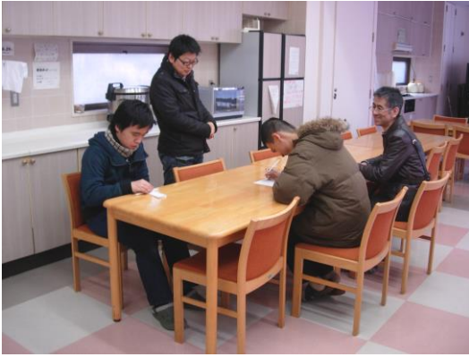
見学を終えて感想文を書いています。