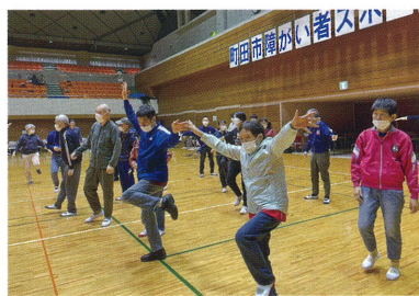
ドリーム事業所 町田市障がい者スポーツ大会