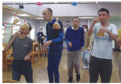
つるかわ学園 東京都障害者スポーツの集い